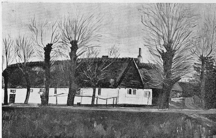
Haraldsborg Mølle set fra Landevejen.

Endnu to Aar efter Møllebranden stod Haraldsborg Møllens Svinghjul ubeskadiget og tomt i sit ødelagte tidligere Skjul. Om Sommeren løb Vandet endnu i fredelige Straaler ned over dets Sider, men Opstemningen og Bruset var forsvundet. Om Vinteren, naar Frosten bed til, satte Vandet sig som et stort Isskæg mageligt til Rette paa dets Vinger. Det var alt, hvad der var tilbage af Aarhundreders Virksomhed. Men ogsaa denne sidste Rest forsvandt. Pladsen, hvor Møllen suverænt havde staaet, fik ved Bebyggelse et helt andet Udseende, og Omgivelserne fulgte med. Kun Vandet, som Tiden ikke mere havde Brug for som Kraftkilde, løber endnu, som Pynt ned over en Rende med mosgroede Sten, for ligesom forhen Goldvandet, fra samme Sted og ud over en grøn Eng, at forsvinde ud i Roskilde Fjord.