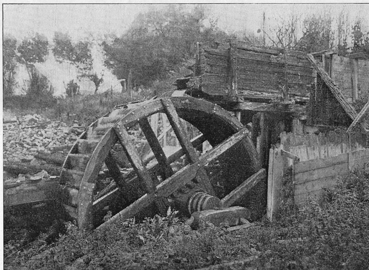
Haraldsborg Møllehjul efter Branden i 1909.

S kærtorsdag d. 8. April 1909 nedbrændte Haraldsborg Mølle. Den laa ved Frederiksborg Landevej, hvor Terrainet endnu omtrent som i Dag ligger lavest og nærmest Roskilde Fjord. Møllens Brand og senere totale Nedlæggelse gav Anledning til den nuværende Frederiksborgvejs endelige Opdagelse og Bebyggelse. Branden kom saaledes belejligt. En Gaardsdreng, der var utilfreds med at være i sin Plads, satte et Lys op i Høet paa et Stænge