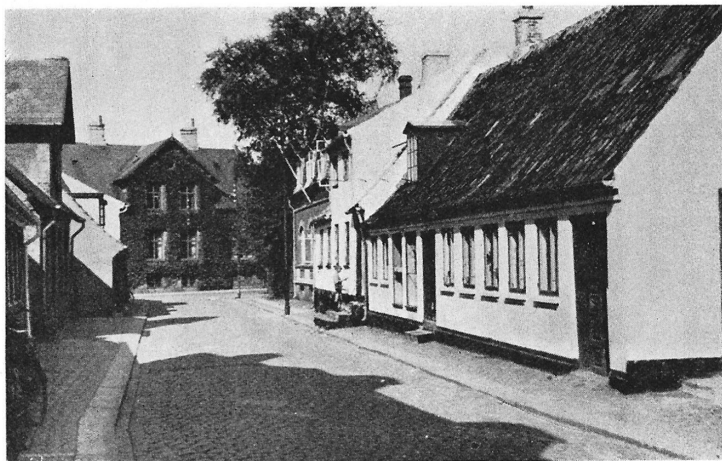
Karen Olsdatter Stræde Nr. 8 og 10 til højre, Nr. 13 og 15 til venstre.