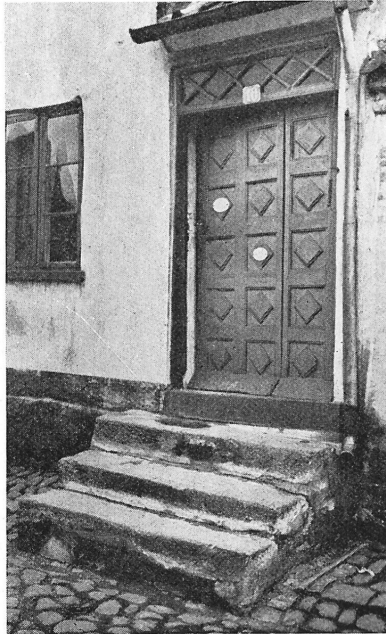
Indgangsdøren til Nr. 10.