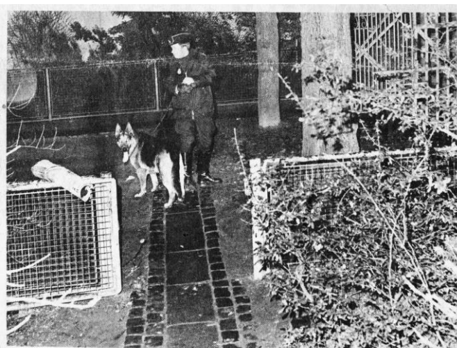
Politiet mødte med fire hunde ved aktionen tidligt i morges, men ingen af aktivisterne forsøgte at stikke af, så der blev ikke brug for dem.