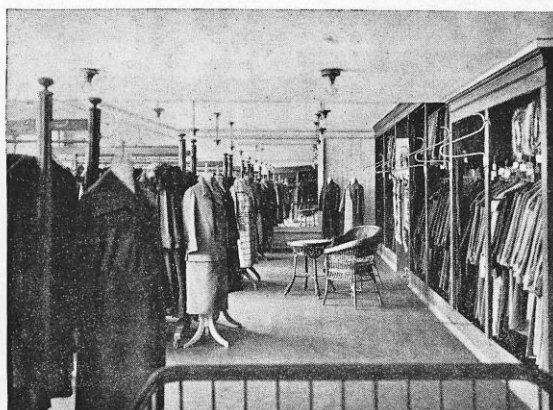
Interior fra Dame-Konfektions Afdelingen paa 1. Sal.