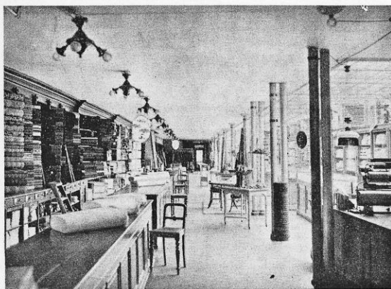
Interior fra Ekspeditionslokalerne i Stue-Etagen.