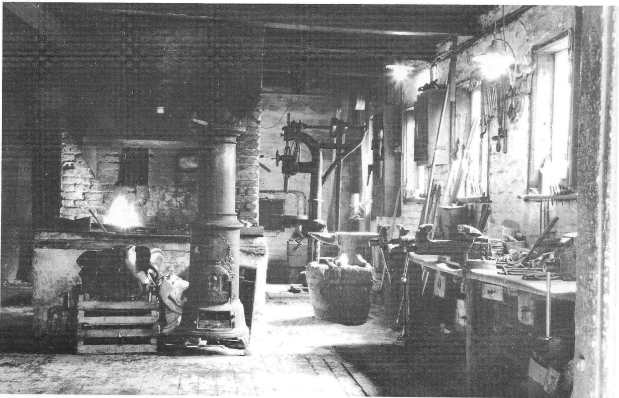
Interiør fra smedien ved vintertide. Kakkellovnen er stillet op for at lune lidt i de kolde måneder, når essens gløder ikke formår at holde kulden ude.