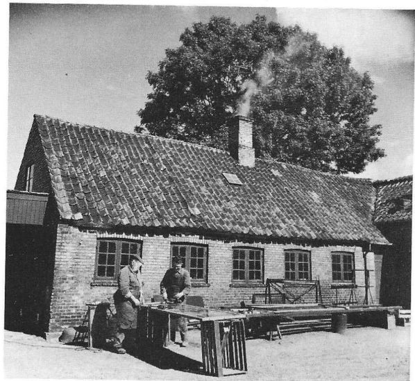
Den gamle smedie i baghuset Algade 55. Billedet er taget i sommer.