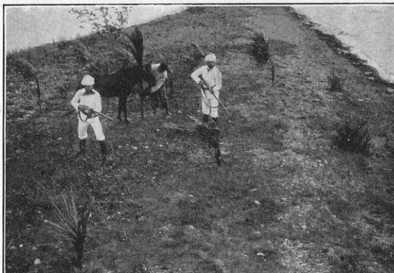
Løvejagten paa Elleore.

Hele Planen blev da lagt til Rette, men Aftenen før Jagten skete der noget uventet, idet en Fisker kom