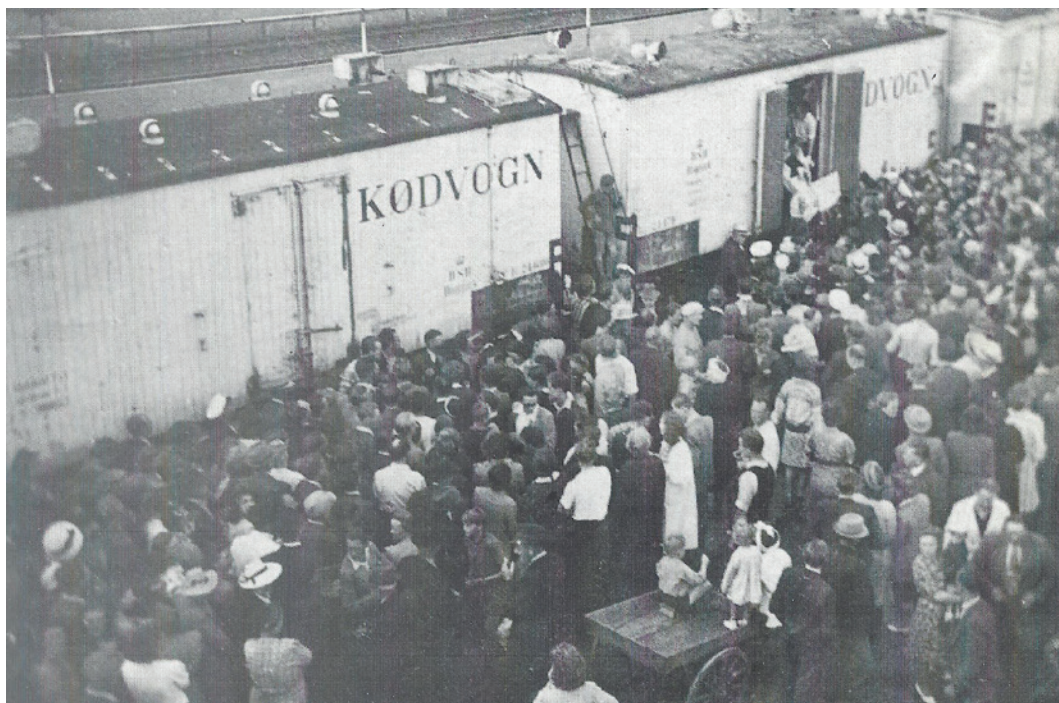
Kødsalg fra jernbanevogne på Roskilde Station under Folkestrejken sommeren 1944. Den voldsomme tilstrømning fik politi og tyskere til at dukke op og sætte en stopper for udsalget.